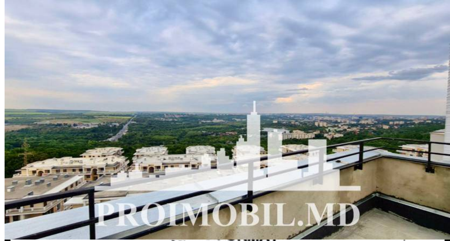
Nivelul: 11 Etaj