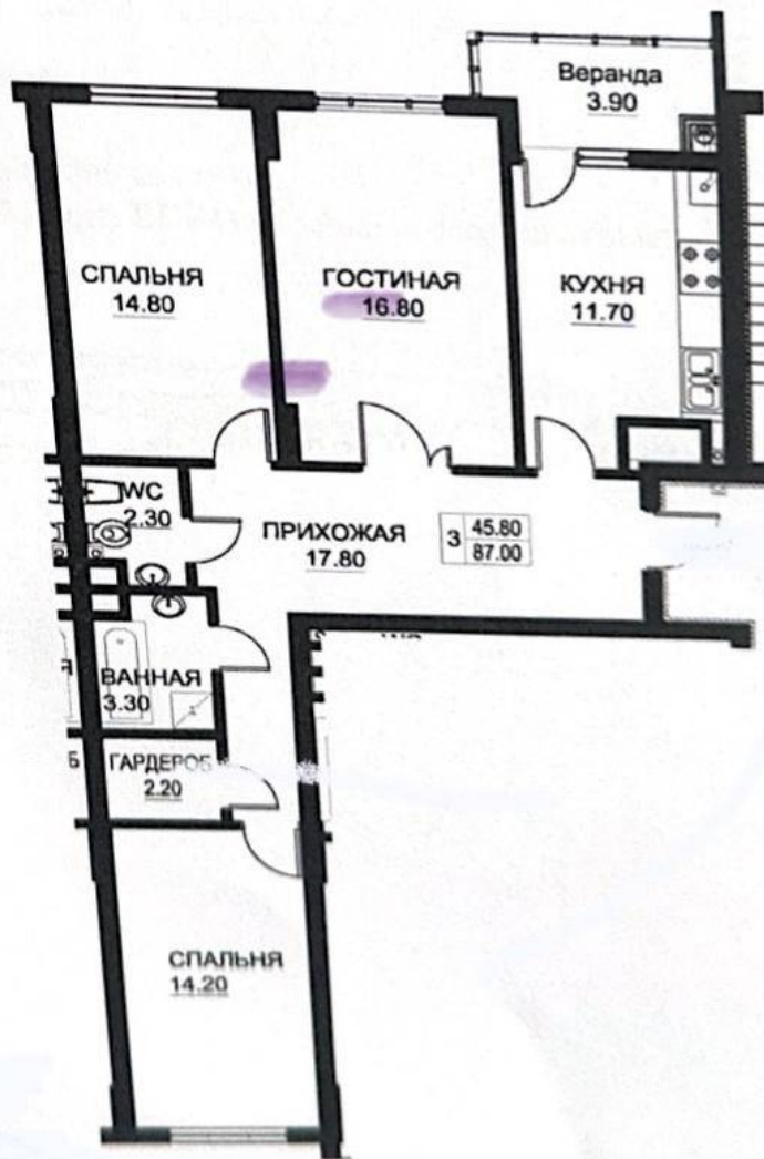
Planul încăperii izolate Scara 1

Anexa nr. 2 la contractul nr. _____ din _____ cu privire la vânzarea/cumpărarea în construcția obiectului "încăpere izolată" din cadrul Blocului locativ amplasat în mun. Chișinău, str. Vasile Lupu 28/C