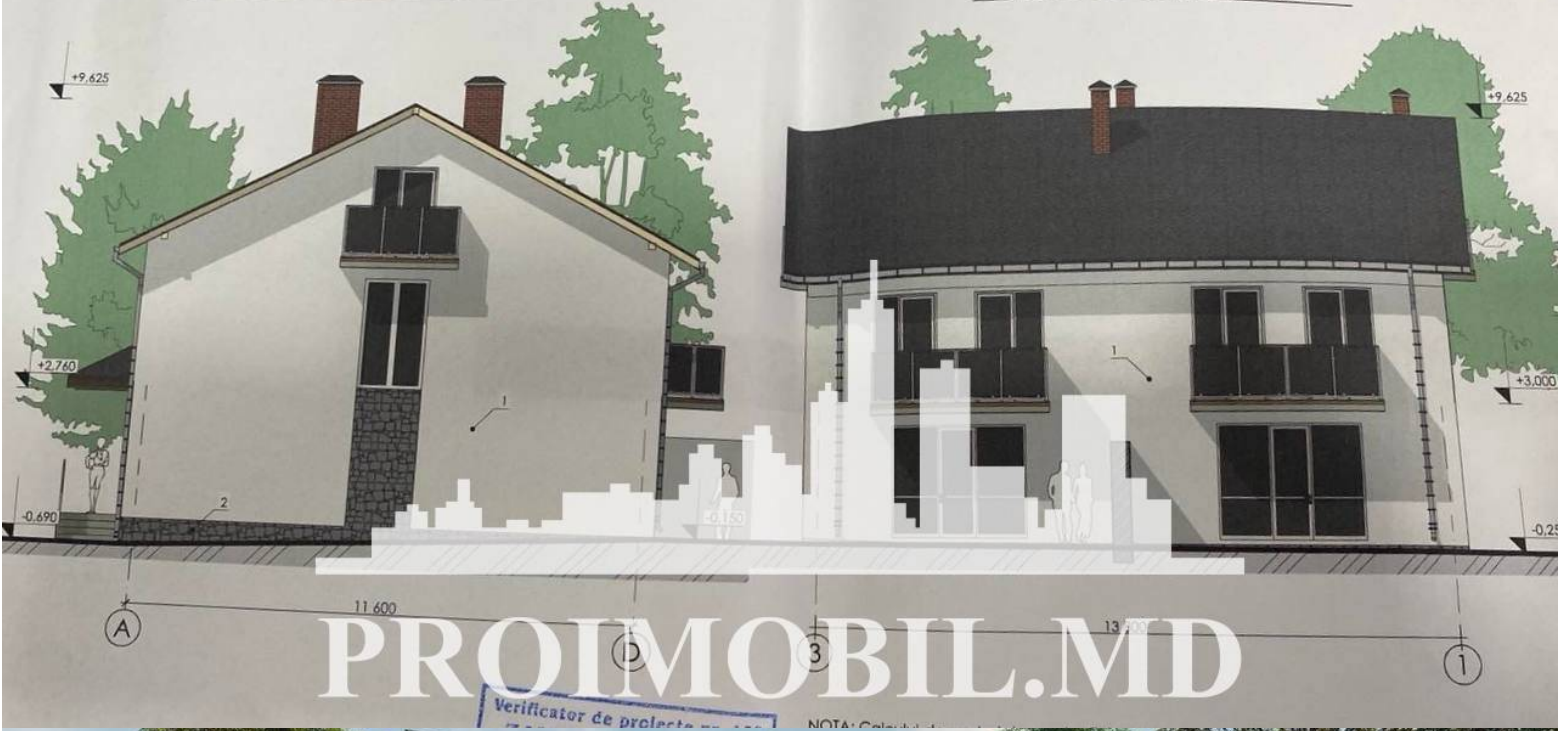
Fatada in axele 4-1, Fisa Coloristica