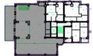
Schema de încadrare al încăperii izolate în planul de nivel Nivel 2 Etaj 1