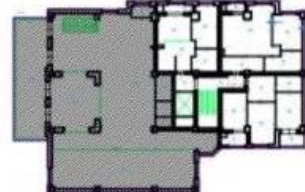
Schema de încadrare al încăperii izolate în planul de nivel Nivel 2 Etaj 1